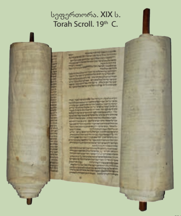
სეფერთორა. XIX ს. Torah Scroll. 19 th C.