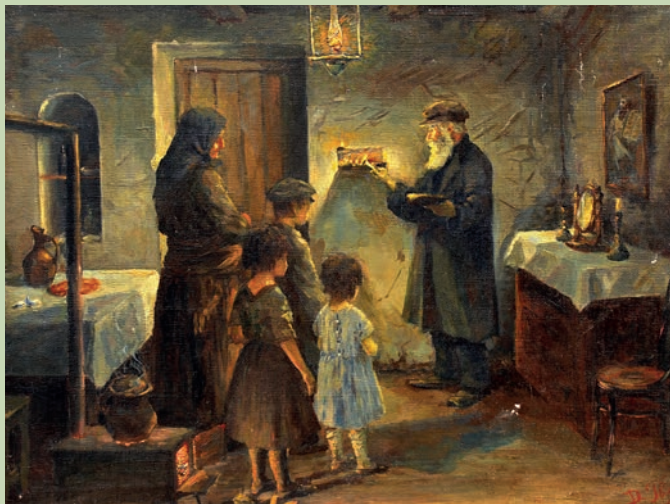
დ. გველესიანი. ხანუქის სანთლების კურთხევა. 1936 D. Gvelesiani. Lightening of Khanuha Candles. 1936