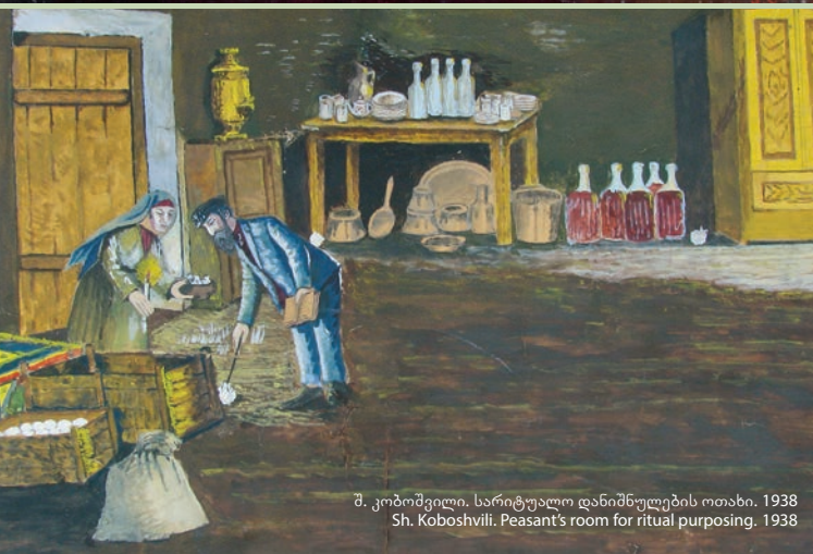
შ. კობოშვილი. სარიტუალო დანიშნულების ოთახი. 1938 Sh. Koboshvili. Peasant's room for ritual purposing. 1938