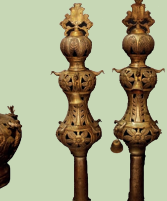
რიმონიმი - სეფერთორის გვირგვინი. XIX ს. Rimmonim – Finial of Torah-Scroll. 19 th C.