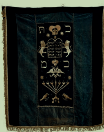
პაროხეტი - სეფერთორის კარაღის ფარდა. XIX ს. Parokhet. Torah Ark curtain. 19 th c.