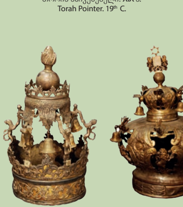
სეფერთორის გვირგვინები. XIX ს. Torah Scroll's Crowns. 19 th C.