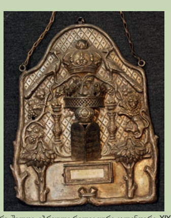
თორა-შილი. ებრაული რელიგიური კალენდარი. XIX ს. Torah-Shield. Jewish religious calendar. 19 th C.