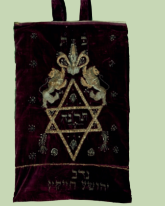
სეფერთორის კაბა. XIX ს. Covering of Torah scroll. 19 th C.