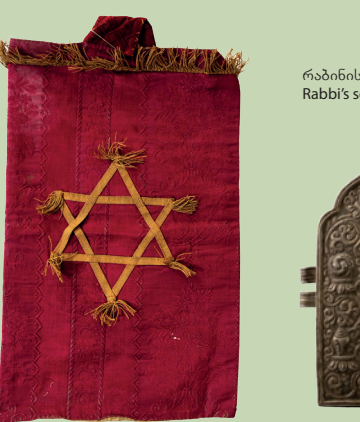
სეფერთორის კაბა. XIX ს. Covering of Torah-Scroll. 19 th C.