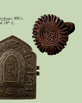
თორის შესანახი ბუდე. XIX ს. Torah's box. 19 th C.