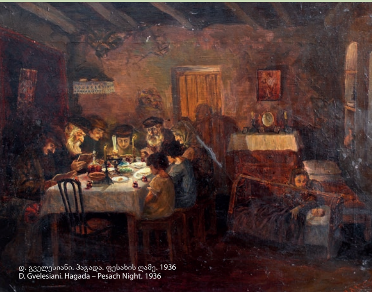
დ. გველესიანი. ჰაგადა. ფესახის ღამე. 1936 D. Gvelesiani. Hagada - Pesach Night. 1936