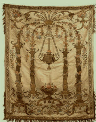
პაროხეტი - სეფერთორის კარაღის ფარდა. XVIII ს. Parokhet. Torah Ark curtain. 18 th c.

Life in Diaspora during the centuries have maintained Jews identity relying on their religion. Jews named Torah “pocket mother land” and Synagogue is not only temple for praying but also the place of gathering and education center. Religious holidays have particular load and meaning for the people deprived of their mother land and indicates their permanent connection with the God and historical Promised Land. This tradition was transferred with great care from one generation to the other and included the rituals not only at the Synagogue but also at home. Given the specific characteristics of Judaism, Jewish culture and art was mostly of ceremonial-cult nature with highly developed decorative arts.