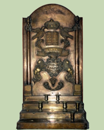
სინაგოგის შანდალი. XIX ს. Synagogue Lamp. 19 th C.