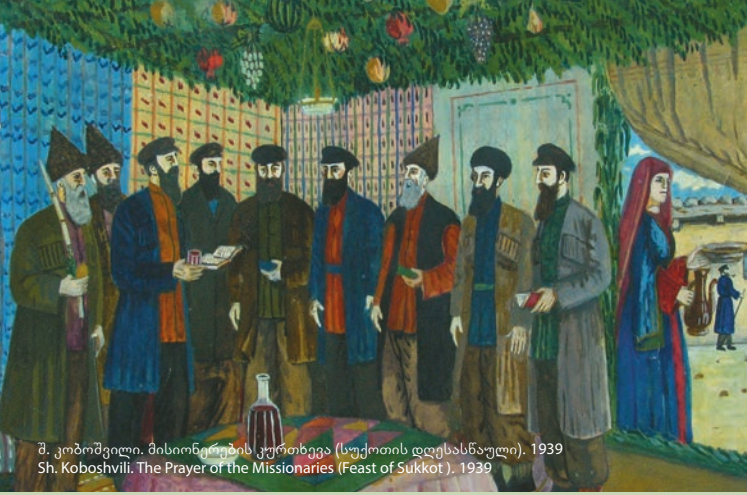
შ. კობოშვილი. მისიონერების კურთხევა (სუქოთის დღესასწაული). 1939 Sh. Koboshvili. The Prayer of the Missionaries (Feast of Sukkot). 1939