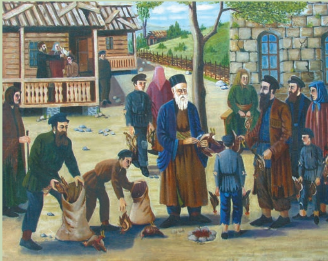
შ. კობოშვილი. ფრინველის დაკვლა რელიგიური წესით. 1939 Sh. Koboshvili. Slaughtering Poultry According to Religious Rules. 1939