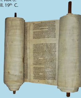
სეფერთორა. XIX ს. Torah scroll. 19 th C.