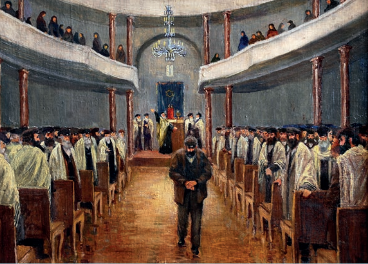
დ. გველესიანი. ანათემის შემდეგ. 1936 D. Gvelesiani. After anathema. 1936