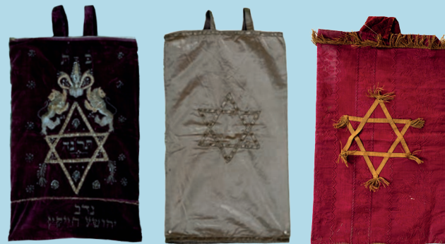
სეფერთორის კაბები. XIX ს. Coverings of Torah scroll. 19 th C.

Jewish Cultural Heritage in the Collections of Georgian National Museum