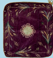
ბალიშის პირი. XIX ს. Pillow cloth. 19th C.