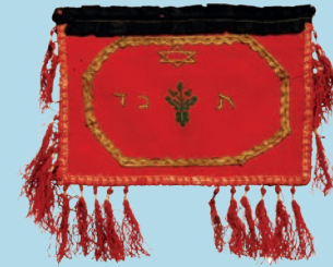
თეფლინის ბუდე. XX ს. დასაწყისი Tefillin bag. Beginning of 20th century