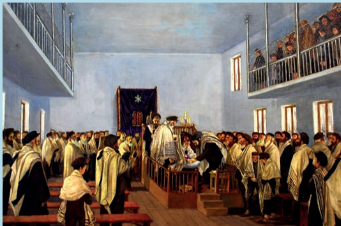
დ. გველესიანი. წინდასაცვეთა სინაგოგაში. 1936 D. Gvelesiani. Circumcision in the Synagogue. 1936