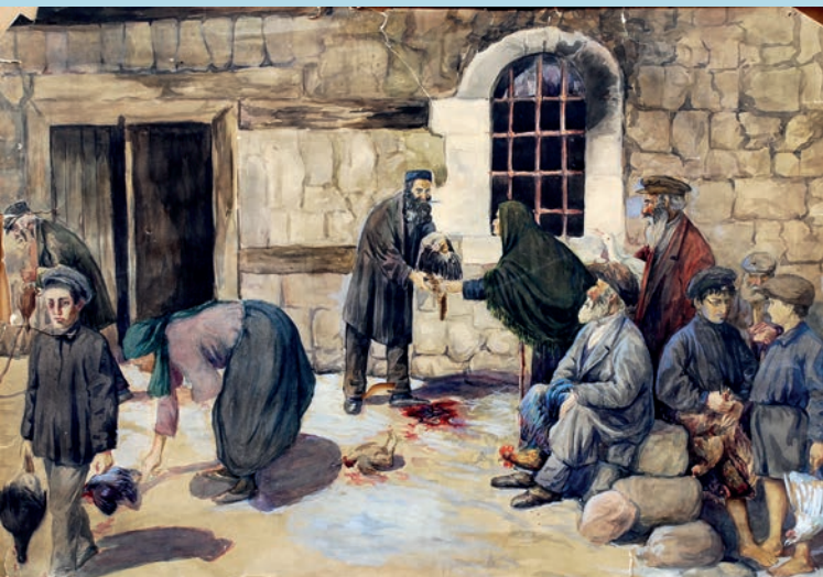
დ. გველესიანი. შოხეთი - ფრინველის დაკვლა. 1936 D. Gvelesiani. Shokhet - Slaughtering poultry. 1936