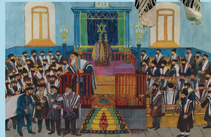
შ. კობოშვილი. ხერემი – ანათემა. 1939 Sh. Koboshvili. Kherem – Anathema. 1939