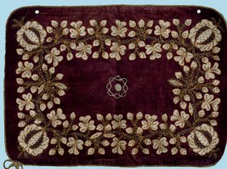
ბალიშის პირი. XIX ს. Pillow cloth. 19th C.