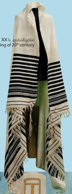
ტალითი. XX ს. დასაწყისი Tallit. Beginning of 20th century