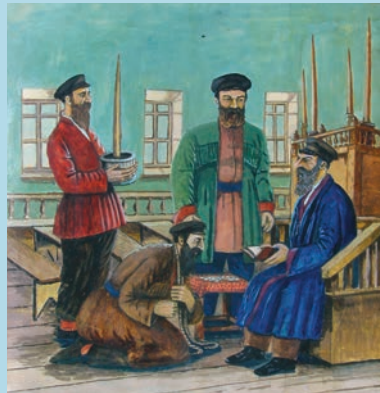
შ. კობოშვილი. პათარა - ცოდვის შენდობა. 1939 Sh. Koboshvili. Hatara - Absolution. 1939