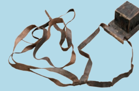
თეფლინი. XIX ს. Tefillin. 19th C.